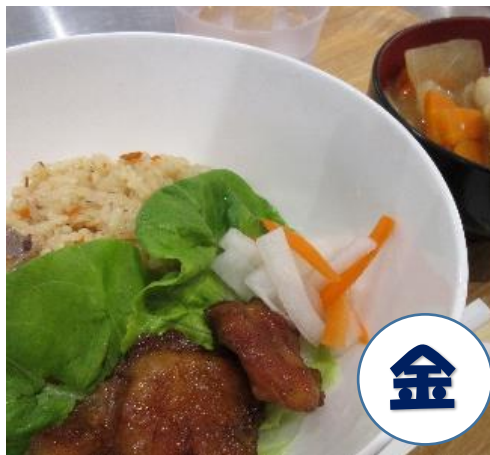
炊き込みご飯&けんちん汁