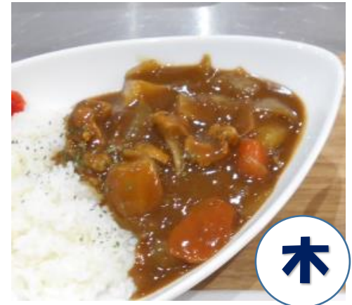
スペシャルカレー