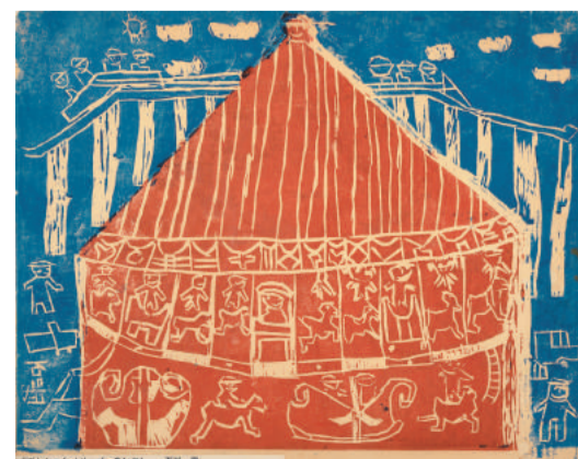
「サントピアワールド」石川 武 (長岡市)